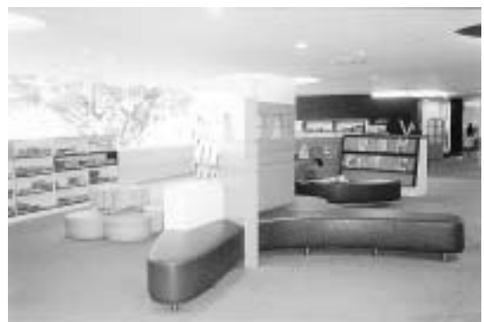
ห้องสมุด Ngu Ann Polytechnic สิงคโปร์

8. ตัวผู้ให้บริการ ไม่ว่าจะเป็นบรรณารักษ์หรือเจ้าหน้าที่ห้องสมุด ควรแต่งกายที่ดูทันสมัย สวยงาม จะออกแบบเครื่องแต่งกายใหม่ใส่แบบยูนิฟอร์มหรือไม่ก็ตาม จะแต่งตัวเซยๆ เก๋ล้ำผมมวย