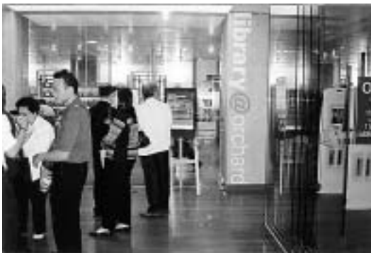
Library@orchard สาขาของหอสมุดแห่งชาติสิงคโปร์ อยู่ที่ชั้น 4 ห้างสรรพสินค้าบนถนน Orchard Road

6. ห้องสมุดควรเชื่อมโยงระบบอินเทอร์เน็ตผ่านเว็บไซต์ของห้องสมุดไปยังห้องสมุดอื่น