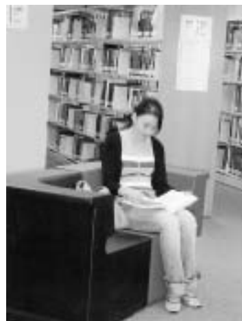
Library@orchard สิงคโปร์