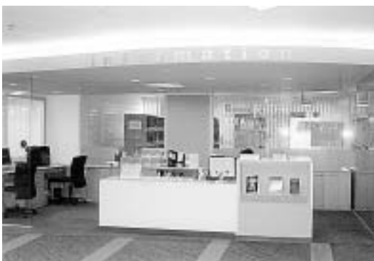
Library@orchard สิงคโปร์