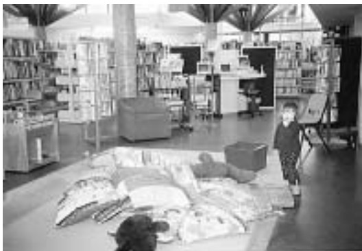
ห้องสมุดประชาชน Taupo ประเทศนิวซีแลนด์

การเลือกวัสดุต้องมีความกลมกลืนสอดคล้องกับสภาพของอาคารและภูมิทัศน์รอบ ๆ อาคารมากที่สุด ตลอดจนระบบการติดต่อสัญจรภายในและหน่วยงานต่าง ๆ ต้องต่อเนื่องและมีความสัมพันธ์กัน เพื่อเป็นประโยชน์ต่อการปฏิบัติงาน