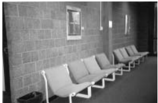
ห้องสมุดมหาวิทยาลัยอินเดียน่า สเตท (Indiana State University) U.S.A.