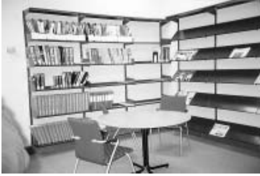
ห้องสมุดมหาวิทยาลัย Otago ประเทศนิวซีแลนด์