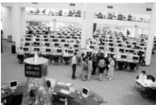
Lee Wee Nam Library

1. การปรับปรุงพัฒนาห้องสมุดและแหล่งสารสนเทศที่มีอยู่ให้เป็นสถาบันมีชีวิต สามารถตอบ