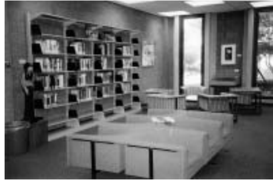
ห้องสมุดมหาวิทยาลัยอินเดียน่า สเตท (Indiana State University) U.S.A.

ใส่แว่นตา คีบรองเท้าแตะ ใส่เสื้อขาว กระโปรงดำ น้ำตาล น้ำเงิน ไม่ได้แล้ว แม่แต่โต๊ะทำงานก็ควรมีการออกแบบใหม่ให้ดูทันสมัย ไม่ใช่โต๊ะสุสานหอยล้านปีหรือเป็นของโหล ถ้าห้องสมุดมีชีวิตแล้วบรรณารักษ์กับเจ้าหน้าที่หน้าตาไร้ชีวิต ไร้ความรู้สึกก็ไม่เข้ากัน เคาน์เตอร์บริการควรหาคนรุ่นหนุ่มสาวมาประจำ ไม่ใช่คนใกล้เกษียณ และควรอบรมให้ยิ้มแย้มแจ่มใส ส่งกระจกดูหน้าตัวเองอยู่เสมอ อบรมให้บริการแบบ Open mind (รับคำตำหนิติเตียนได้) ไม่ใช่ Service Mind (ทำตามหน้าที่เท่านั้น)