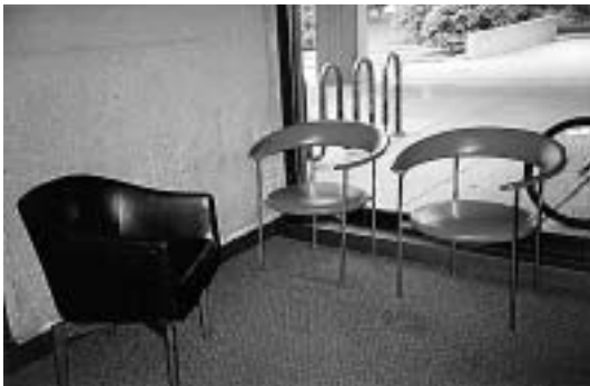
เฟอร์นิเจอร์หลากหลายแบบ ห้องสมุดมหาวิทยาลัยอินเดียน่า สเตท (Indiana State University) U.S.A.