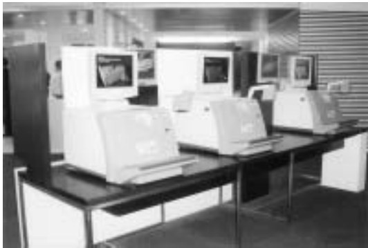
เครื่องยืม-คืนอัตโนมัติ ห้องสมุด Ngu Ann Polytechnic สิงคโปร์

สว่าง ระบบเสียง และการป้องกันอัคคีภัย นอกจากนี้ควรมีจำนวนเครื่องคอมพิวเตอร์ที่มากพอสมควร ไม่ต้องรอคิวแย่งกันใช้ ห้องบริการคอมพิวเตอร์ต้องมีการออกแบบที่มีศิลปะ สวยงาม ไม่ใช่เอาโต๊ะเก้าอี้มาเรียงต่อกันเฉย ๆ เป็นแถวยาว เก้าอี้ควรนั่งสบาย มีพนักพิง ไม่ใช่เก้าอี้กลม ควรมีสีสัน เช่น สีแดง สีส้ม โต๊ะวางคอมพิวเตอร์ควรมีการออกแบบที่ดูสวยงามน่าใช้ เป็นสัดส่วน ไม่นั่งเบียดกัน หรือนั่งคู่คู้ยกันเวลาใช้งาน