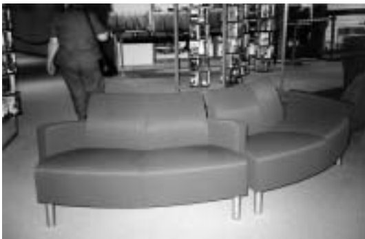
เฟอร์นิเจอร์ฟอร์มตี Vigo County Public Library U.S.A.