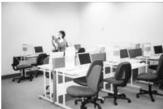
การจัดแบบธรรมดา มหาวิทยาลัย Otago นิวซีแลนด์

4. สิ่งบันเทิงล่อใจเยาวชน ห้องสมุดจะต้องมี VCD, DVD ภาพยนตร์ให้ใช้ในห้องสมุดและยืมกลับบ้านได้ มีเคเบิลยูพีซีให้เลือกหลากหลายช่อง มี CD เพลงให้ฟังภายใน (เดี่ยว) และยืมกลับไปฟังที่บ้านได้ หรือมีเกม (สร้างสรรค์) ให้ยืมเล่นหรือยืมกลับบ้าน มีรายการโทรทัศน์ต่างประเทศผ่านดาวเทียมให้เลือกดู