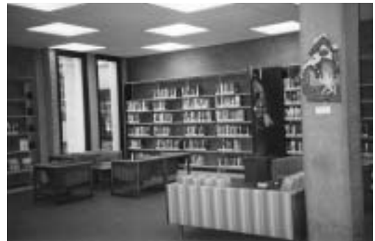
ห้องสมุดมหาวิทยาลัยอินเดียน่า สเตท (Indiana State University) U.S.A.

3. ใช้เทคโนโลยีสารสนเทศที่ทันสมัยและจับใจ เช่น คอมพิวเตอร์จอแบนที่มีสมรรถนะสูงอินเทอร์เน็ตความเร็วสูง (Hi-speed) มีฐานข้อมูลมากมายหลากหลายให้เลือกใช้ มีระบบ RFID ใช้ มีเครื่องยืมคืน